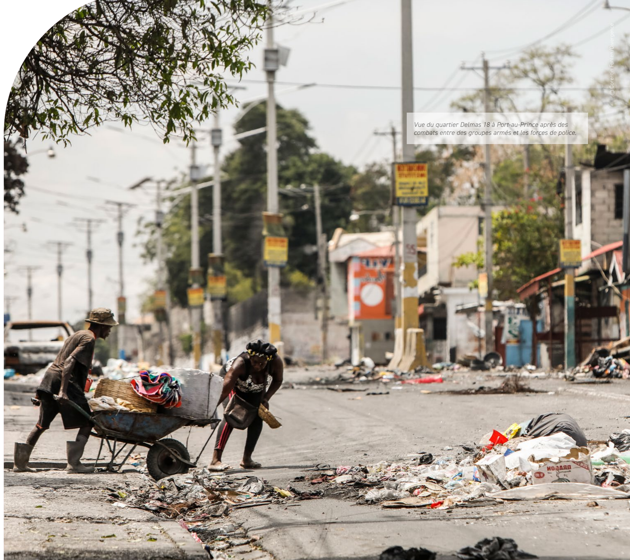
Vue du quartier Delmas 18 à Port-au-Prince après des combats entre des groupes armés et les forces de police.

Une survivante de violences sexuelles de Port-au-Prince, à Haïti